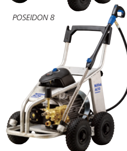
POSEIDON 8 ST