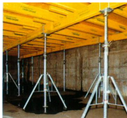
eller C20 dragere