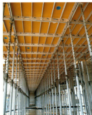
Støtter med TOPEC