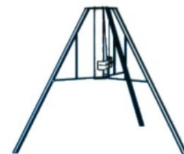
Trefod – opstillingsstøtte Varenr. 092 180